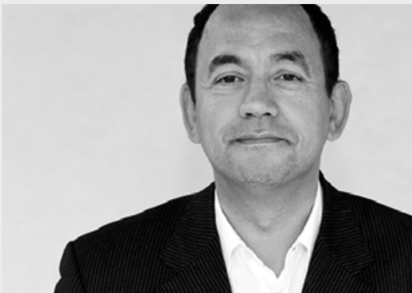
« Nous nous félicitons que la Commission ait accordé aux États membres la liberté de choisir eux-mêmes les groupes qui auront droit à un logement social »

Nous nous félicitons que la Commission ait accordé aux États membres la liberté de choisir eux-mêmes les groupes qui auront droit à un logement social. Ce serait vraiment formidable si le gouvernement néerlandais ou le ministre néerlandais responsable utilisait cette liberté pour fixer un plafond de revenus supérieur ou des plafonds différenciés. Il sera alors possible de préserver notre politique de « ville sans ghettos » à Amsterdam. ■