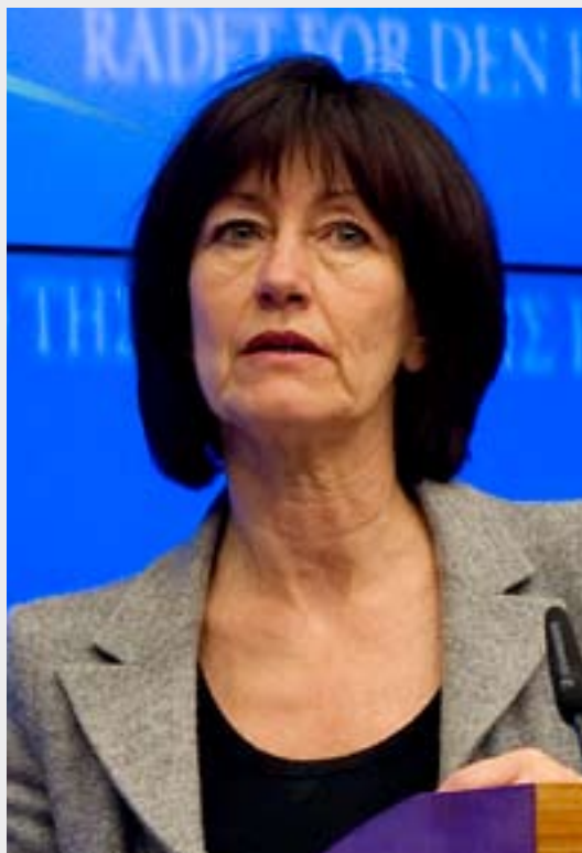
« Une approche régulatrice est en partie une réponse à la question sociale »

sions », nous avons mis sur la table des pistes très concrètes sur l'adaptation des règles en matière de marchés publics, mais également pour les aides d'État, et concernant la libre prestation des services.