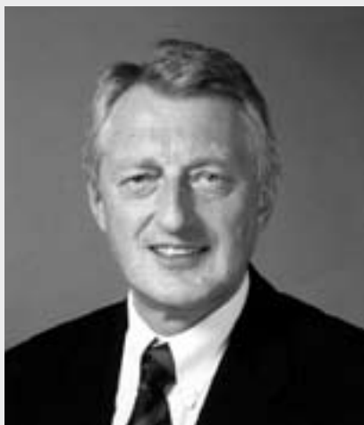
«L'Europe est plus un facilitateur qu'un obstacle »

Un modèle de logement social efficace offre une solution de logement adéquate pour tous les citoyens. Un modèle parfait permettrait d'éradiquer les formes les plus sévères d'exclusion du logement, sans abris ou logements surpeuplés. Il jouerait également un rôle pour stabiliser les marchés du logement et rendre le logement durable dans le long terme. Je pense que le modèle autrichien se conforme aux principaux objectifs que je viens de décrire, basé sur des incitations touchant l'ensemble des acteurs du marché. Le secteur du logement social en Autriche est diversifié, avec des acteurs privés sans but lucratif, publics et en coopérative, en fonction de la situation locale. Le mécanisme de financement est intéressant parce qu'il s'agit d'un canal financier en circuit fermé, où les gens peuvent économiser de l'argent dans les banques de logement, qui vont émettre des obligations de logement social. Il donne à votre épargne un impact direct sur l'amélioration des marchés