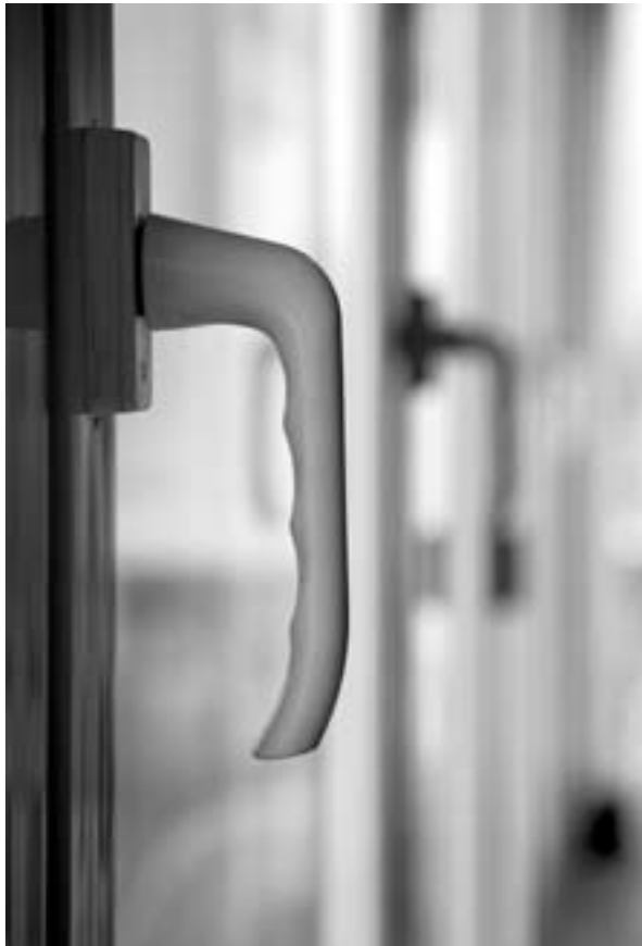
Le CESE a suggéré que les objectifs d'efficacité énergétique aient également une portée sociale

raient probablement des dépenses supplémentaires pour les États membres ». Les Pays-Bas, quant à eux, s'opposent à tout objectif contraignant de quelque nature que ce soit en la matière. A contrario,