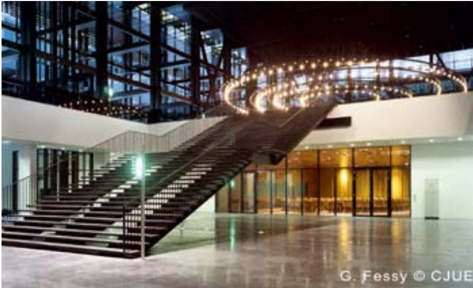
Le Tribunal de l'UE a été appelé à trancher ce sensible débat qui met en question les limites du contrôle de la Direction générale de la concurrence de la Commission

Le premier a été radié après clarifications sur les missions de la banque. Dans le second, les Fondations de logement social néerlandaises soutiennent en substance que la Commission a outrepassé sa compétence en imposant aux Pays-Bas une nouvelle définition du logement social conforme à ses vues et a décidé à tort qu'un Etat membre doit définir le service d'intérêt économique général sur la base d'un seuil de ressources.