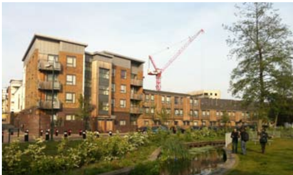
Il peut s'agir d'entreprises qui fournissent des biens et services à un public vulnérable, comme l'accès au logement

Parallèlement, le Comité de la protection sociale avait publié un « cadre volontaire européen de qualité » pour les services sociaux, établissant des normes de qualité basées sur les principes généraux suivants : disponibilité, accessibilité, caractère abordable, personnalisation, globalité, continuité, priorité aux résultats. Ce « cadre » ( disponible sur http://ec.europa.eu/social/main.jsp?catId=794&langId=fr ) introduit également des principes de qualité pour les relations entre les prestataires de services et les utilisateurs ainsi que des standards de qualité pour les relations entre les prestataires, les autorités publiques, les partenaires sociaux et d'autres parties prenantes. ■