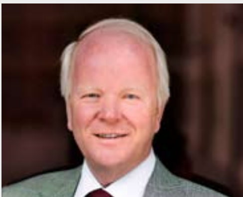
Les sociétés de logement publiques fonctionneront selon une logique commerciale

La suppression progressive des aides d'Etat allouées à la construction de logements a déjà commencé au début des années 1990. Consécutivement, d'une part, à la plainte adressée par la Fédération européenne de