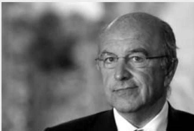
« Nous voulons protéger l'existence de ces SIEG et instaurer des règles plus simples et plus claires »

Il ressort de nos consultations avec les Etats membres, les fournisseurs de SIEG, les réseaux de pouvoirs locaux qu'une collectivité publique de 10000 habitants, a une capacité de gestion telle qu'elle peut sans problème nous fournir les documents comptables adéquats, dans des conditions de transparence permettant de voir comment est géré l'argent public. Ce que nous demandons n'est pas énorme et la procédure est rapide si on nous transmet l'information correcte.