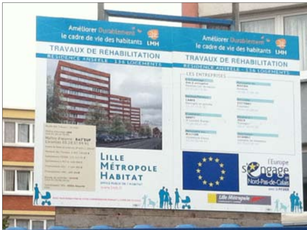
Le règlement FEDER a permis à tous les Etats membres d'investir de l'argent provenant des Fonds structurels dans la rénovation énergétique des logements

Quels résultats ? Dans plusieurs Etats membres, le succès est au rendez-vous. La France est souvent citée en exemple. Dans un rapport transmis le 18 mai 2011 au président de la Commission européenne, l'Union sociale pour l'habitat (USH) a calculé que cette mesure a généré dans ce pays, en moins de 22 mois, plus d'un milliard d'euros d'investissement dans les logements sociaux. « 50 000 ménages à revenus modestes vont bénéficier concrètement de votre mesure par une réduction sensible de leurs dépenses de chauffage », écrit Thierry Repentin, le Président de l'association, à José Manuel Barroso. Et sur base d'un rythme de programmation constant, calcule-t-il, ce sont